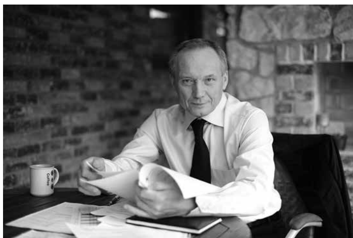
УЛАДЗІМІР НЯКЛЯЕЎ / ВЛАДИМИР НЕКЛЯЕВ / ULADZIMIR NIAKLIAEU