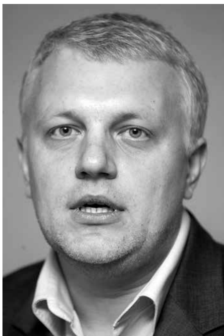
ПАВАЛ ШАРАМЕТ / ПАВЕЛ ШЕРЕМЕТ / PAVAL SHARAMET